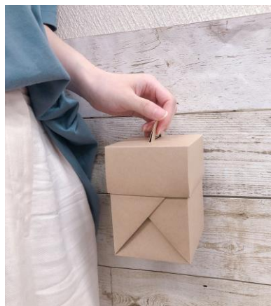
キャリアハコラップ（外見）