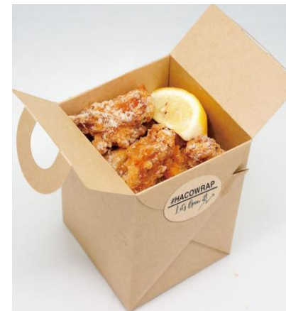
キャリアハコラップ